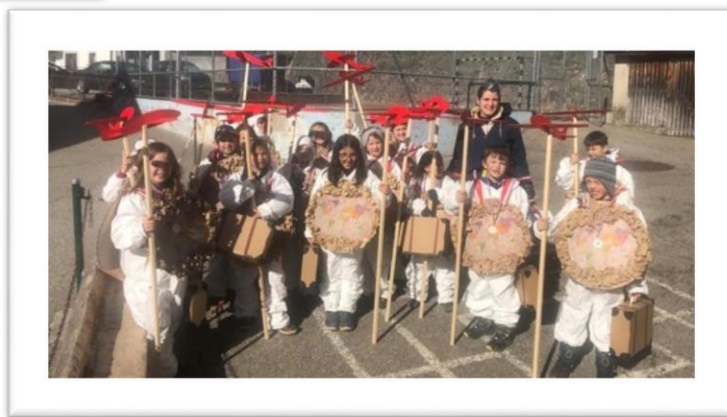
Les enseignant-e-s du cercle scolaire de Haut-Intyamon