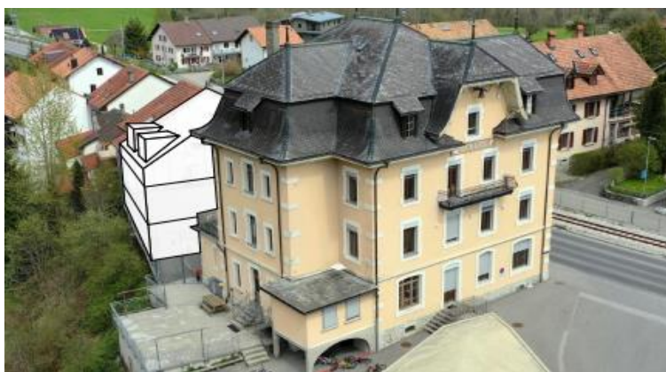
Cette représentation est uniquement fournie à des fins de compréhension

Le bâtiment est situé en zone Village I et jouit d'une situation centrale. L'immeuble construit en 1906, transformé en 1991, est dans un état d'entretien qualifié de vétuste. L'entretien de ce bâtiment coûte plus de 40'000 CHF par an à la collectivité. Le bâtiment est raccordé au chauffage à distance (CAD) de la Commune. Des moyens conséquents sont nécessaires pour entreprendre une rénovation et transformation en vue d'en faire exclusivement un immeuble de logements. Le Conseil communal n'a pas de propre projet de développement immobilier pour cet immeuble.